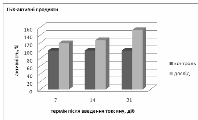
Рис. 1. Активність ТБК-активних продуктів в еритроцитах білих щурів за дії афлатоксину В1

Як видно з представлених даних (рис. 1), на 7, 14 і 21 доби експерименту рівень ТБК-активних продуктів зростає, відповідно, на 19, 27 і 53 % ( p < 0,05-0,01 ). Це свідчить про розвиток оксидативного стресу — загрозливого стану, який проявляється в клітинах тварин після введення афлатоксину В1. Як відомо, оксидативний стрес відбувається у випадках, коли рівень утворення АФО перевищує здатність клітин до детоксикації цих реакційно активних радикалів та сполук [8]. Тому збільшення показника інтенсивності пероксидного окиснення ліпідів, встановлене в наших дослідженнях, можна пояснити зниженням антиоксидантного потенціалу клітин.