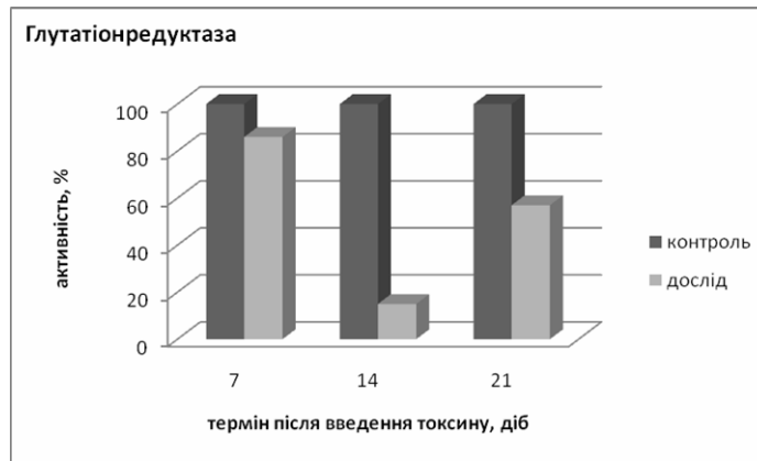
Рис. 3. Активність глутатіонредуктази в еритроцитах білих щурів за дії афлатоксину В1

Отримані результати щодо пригнічення активності ферментів антиоксидантних ферментів в еритроцитах свідчать про можливі порушення кисень-транспортної функції в організмі тварин за умов надходження афлатоксину В1.